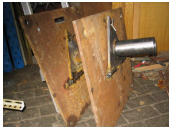
De hulpstukken voor de antennemast.