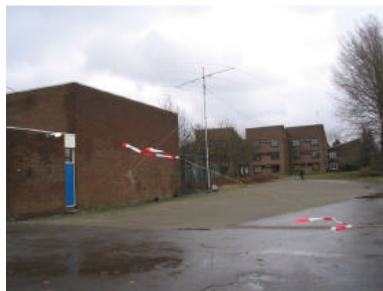
De 4 elm. Antenne voor 20 meter.