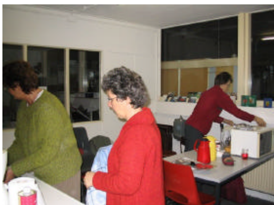
De vrouwen bezig in de keuken.

We hadden de XYL's gevraagd om de catering te verzorgen. Aan dit verzoek is ruim gehoor gegeven.