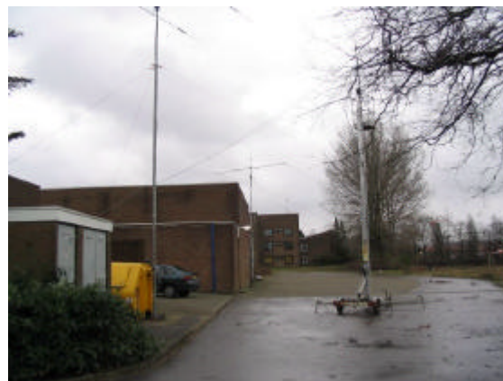
Nog een antenne-overzicht.