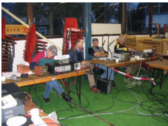
Er moesten verbindingen worden gemaakt !!

Halverwege de avond ging een gedeelte van de aanwezigen naar huis om de nachtrust te genieten. De rest bleef de nacht doorwerken met het maken van verbindingen.