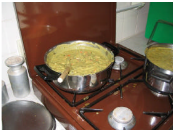
Hier ging het om.. Snert!!