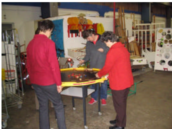
De vrouwen proberen een spel.

Toen de middag overging in de avond moest er wat gegeten worden. En dit natuurlijk met de XYL's erbij. Enkelen gaven de voorkeur aan een pizza, de rest aan een grote loempia. We lieten het ons goed smaken.