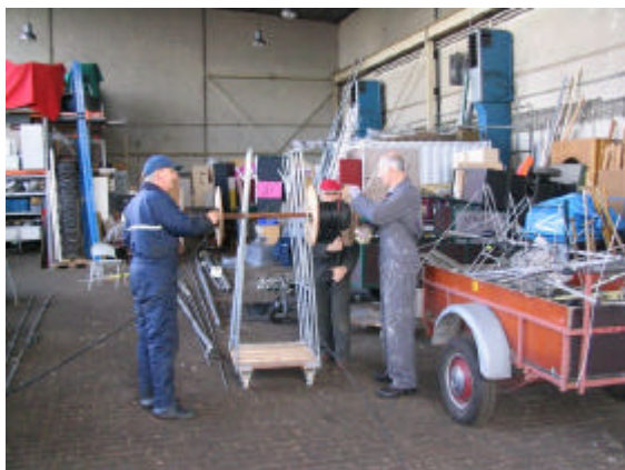
Het oprollen van de coaxkabels.

De HF-antenne van Evert werd keurig opgeborgen. We zijn tot de conclusie gekomen dat deze antenne eigenlijk te groot is om opnieuw voor een evenement te gebruiken. We gaan nu met een paar personen bij de SOMA de spullen verder reviseren en gebruik klaar maken. Al met al kunnen we opnieuw terug zien op een geslaagde PACC contest waarbij de onderlinge verstandhouding is versterkt.