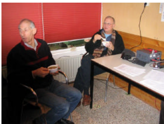
Die smaakte goed.

Aan dit gebeuren deden in het totaal 20 personen mee. Ook dit evenement was weer zeer geslaagd. Geen verkeerd woord, zodat het de saamhorigheid weer zeer ten goede kwam.