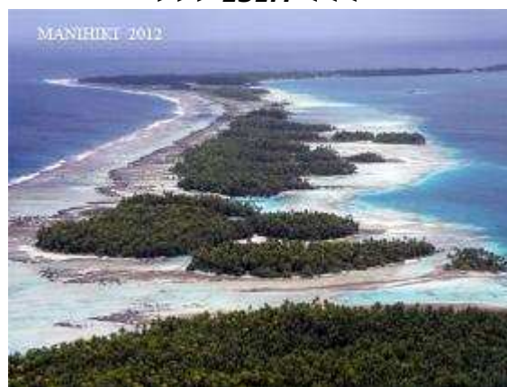
Manihiki Atoll, Noord-Cook Isl.