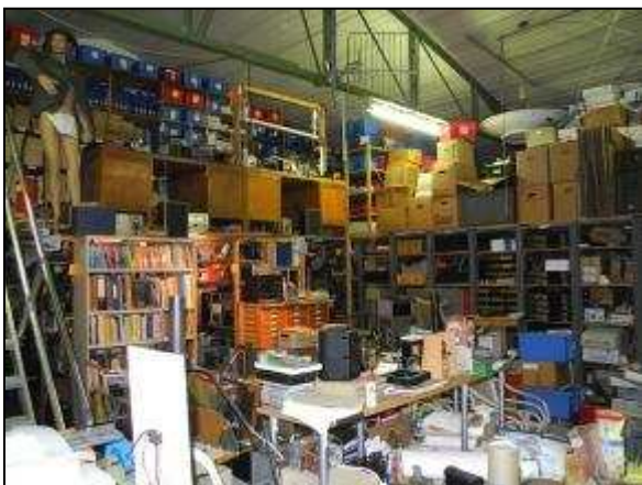
Een hoekje van de opslagloods met werkplekken

de gerealiseerde bouwontwerpen uit amateurbladen met origineel artikel ernaast en niet te vergeten zelfbouw naar ontwerp van de maker zelf. Dit alles werd opgeluisterd met door Cor Moerman opgediste smeulige verhalen, zodat we ons geen moment verveelden.