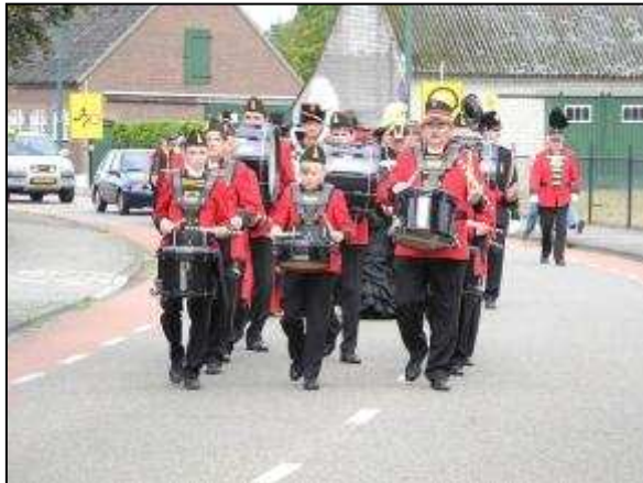
Daar komen de schutters, daar komen ze aan...