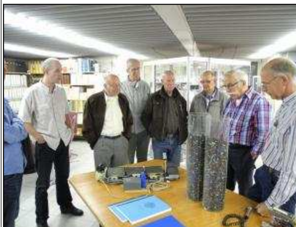
Bij de mobilfoonset en de twee cilindres met uitgetrokken/uitgeknijpte Eproms.