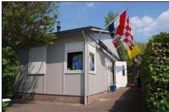
Het radiomuseum Jan Corver