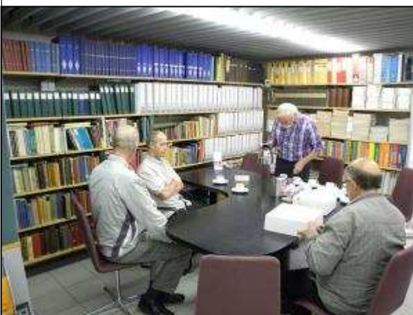
Aan de koffie.