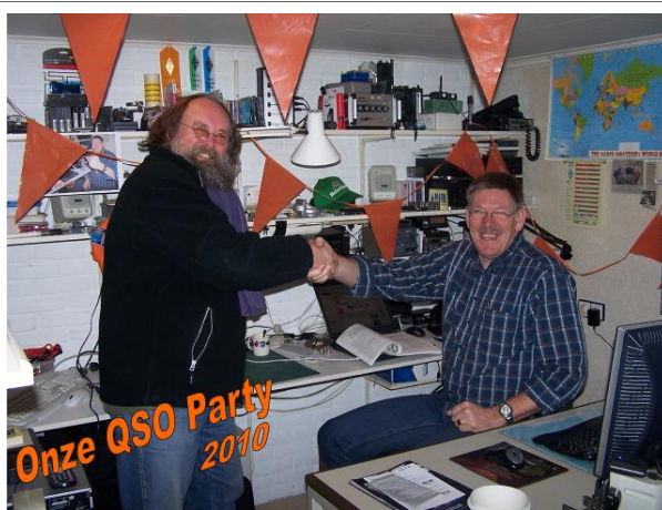
Een sfeerbeeld van de QSO party zondag 21 november 2011