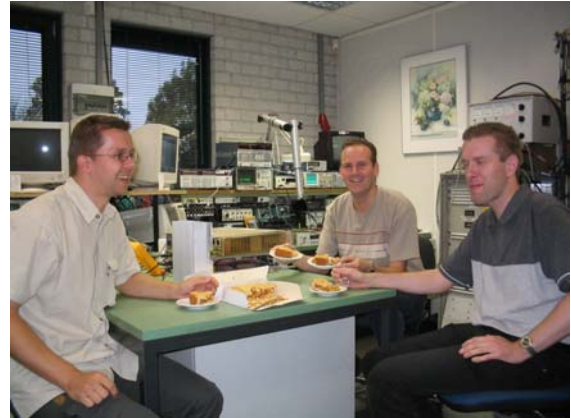
Bedankt voor de vossenjacht.