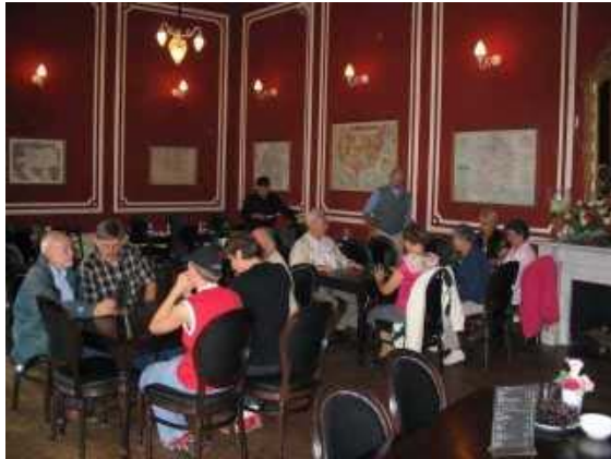
Eerst de koffie.