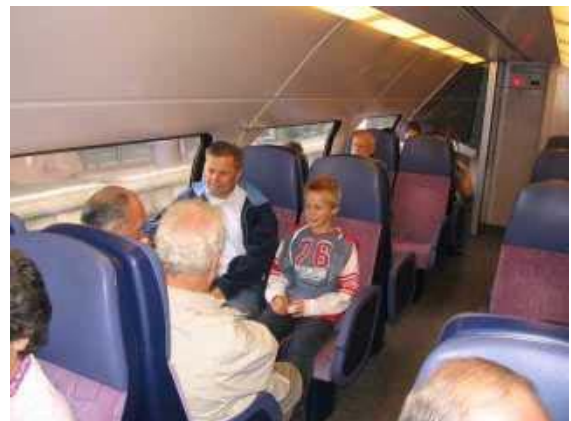
In de trein.

Zaterdag 23 september was het dan zover. We gingen naar het Spoorwegmuseum in Utrecht. Het grootse aantal mensen ging met de trein. Het gezin van Wolter PA5WN en Yvonne ging per auto.