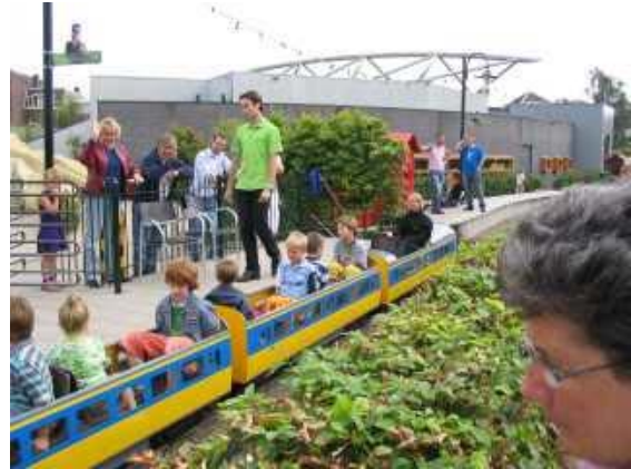
Voor de kinderen.

Om 17:00 uur was iedereen terug in de ontvangsthal en dus konden we naar het eetcafé "Eigen Schuld". Het was daar even inschikken wat de ruimte betreft, maar het lukte allemaal. De snelheid van de bediening en de kwaliteit van het eten waren voortreffelijk.