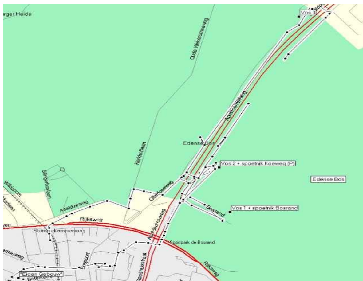
De vossenjachtroute van de groep Rijk PE1PTJ