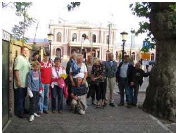
Een gedeelte van de groep met op de achtergrond het museum.

Het museum is zeer uitgebreid en ontzettend leuk opgezet. Ieder ging zijn eigen weg in het museum. Toen we ons weer verzameld hadden, bleek dat velen toch nog wel een en ander hadden gemist. Er was dan ook zeer veel te bekijken. Drie uur bleek aan de krappe kant. Achteraf hadden we wel een uurtje langer kunnen blijven.