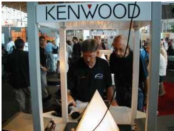
Mooi spul allemaal

de bezoekers van de beurs gratis gebruik konden maken. Dat scheelde toch maar lekker zo'n 800 meter lopen. Prima geregeld in ieder geval. Bij de ingang een toegangsbewijs voor alle dagen aangeschaft en naar binnen. Tja, waar het eerste heen? We besloten om eerst naar de vakhandelaren te gaan omdat we op de markt over de koppen konden lopen. Afgesproken dat we op een bepaalde plaats om zo en zo laat zouden staan als we elkaar uit het oog zouden verliezen en toen hopte, in het gewoel naar de handelarenhal.