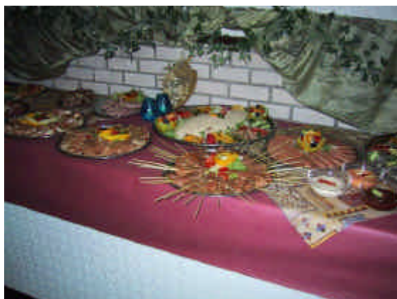
25 jaar Zuid-Veluwe.

Het ziet er naar uit dat we één van de terreinen achter de Camping de Kijkvelder in Lunteren kunnen gaan gebruiken, maar als alles definitief is horen jullie dat nog.