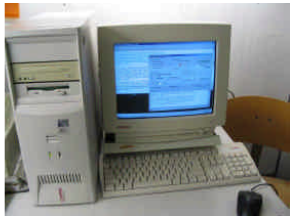
De nieuwe computer.