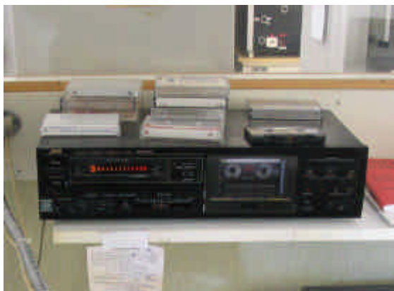
De cassette recorder.