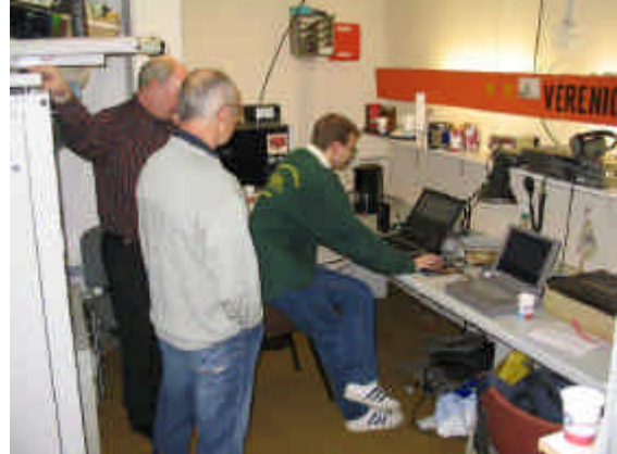
De laatste test.

25 maart is er een crewvergadering waarin wordt besloten hoe dit gestalte gaat krijgen.